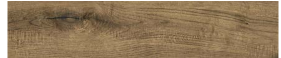
红橡木 • Rovere G