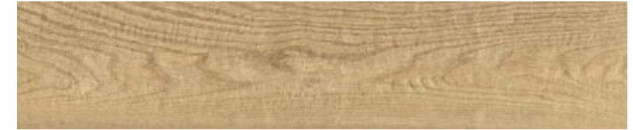
自然色 • Natural H