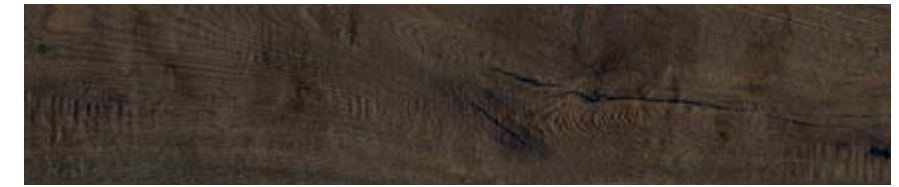
黑橡木 • Quercia G

规格 • Sizes • Formati • Formats • Formate • Formatos