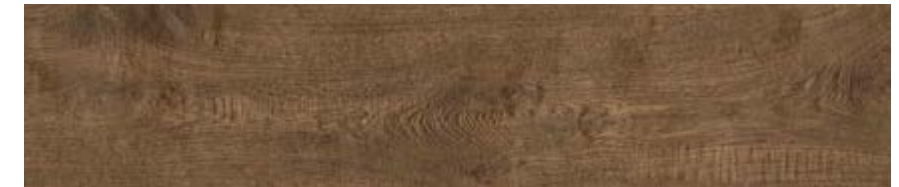
棕栗木 • Castagno G