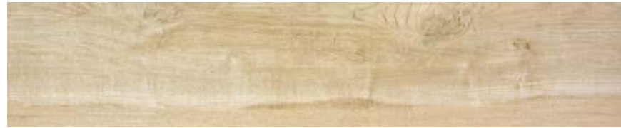
桦木 • Betulla

30x120 Treverkhome Quercia, Rovere, Castagno, Betulla