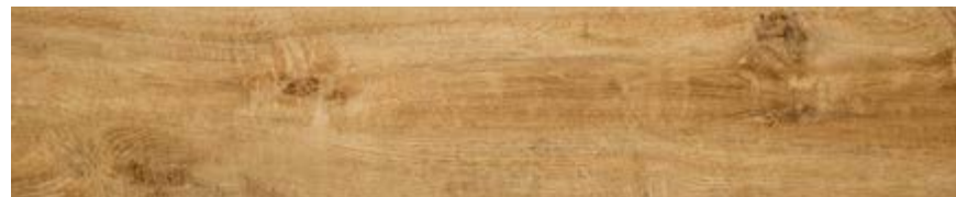
松木 • Larice