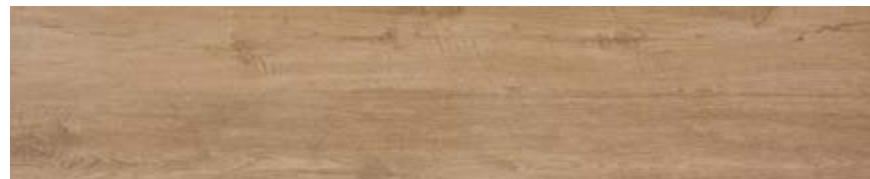
红橡木 • Rovere