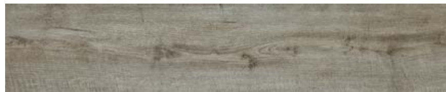
栲木 • Frassino