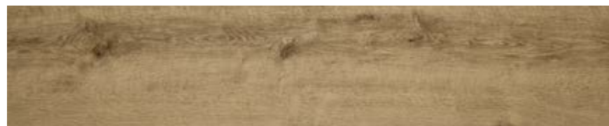
榆木 • Olmo