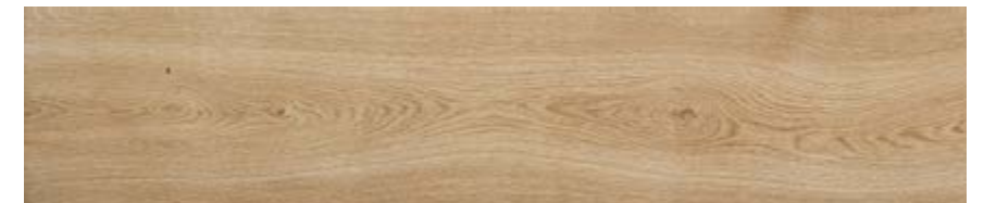
沙黄色 • Sand [H]