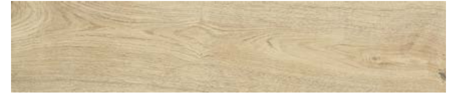
自然色 • Natural [H]

符合 • According to • Conforme • Conforme • Gemäß • Conforme UNI EN 14411 - G BIa