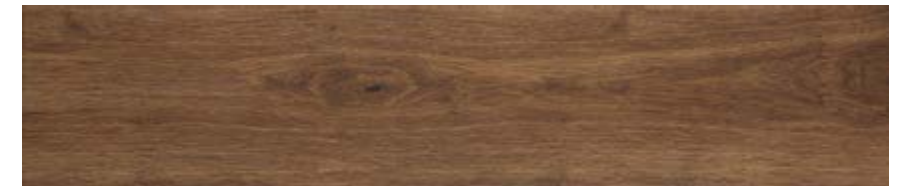
丁香色 • Clove [H]

规格 • Sizes • Formati • Formats • Formate • Formatos