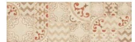
MMV3 花砖 • Pottery Decoro Azulejo 25x76