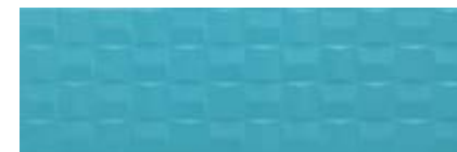
MMVH 湖水蓝 立体砖 • Pottery Turquoise Struttura Cube 3D 25x76