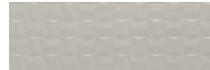
MMV1 银灰色 立体砖 • Pottery Silver Struttura Cube 3D 25x76