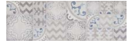
MMVF 花砖 • Pottery Decoro Azulejo 25x76

Rif. 白色/湖水蓝/海蓝 • Light / Turquoise / Ocean