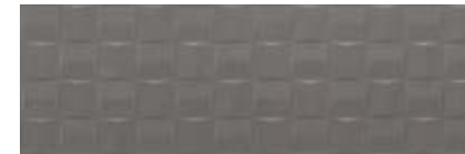
MMV2 深空灰 立体砖 • Pottery Slate Struttura Cube 3D 25x76