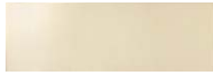
MMUT 香槟金 • Pottery Champagne 25x76