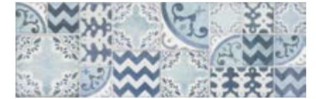
MMV4 花砖 • Pottery Decoro Azulejo 25x76

Rif. 白色/湖水蓝/海蓝 • Light / Turquoise / Ocean