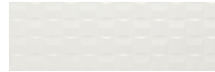
MMV0 白色 立体砖 • Pottery Light Struttura Cube 3D 25x76