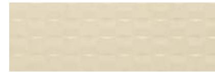
MMUZ 香槟金 立体砖 • Pottery Champagne Struttura Cube 3D 25x76