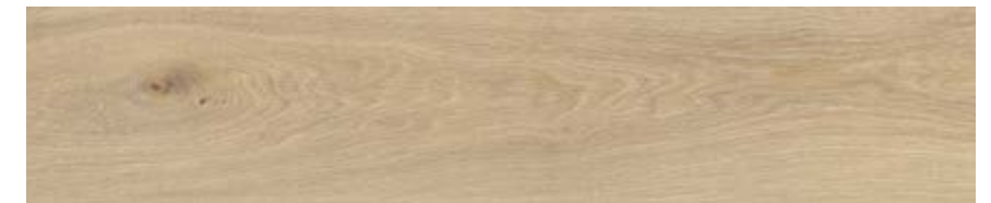
自然色 • Natural