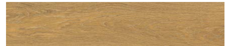
焦糖色 • Caramel