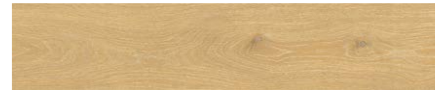
沙黄色 • Sand