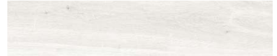
白色 • White