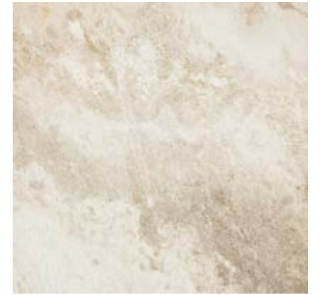
米黄色 • Beige

规格 • Sizes • Formati • Formats • Formate • Formatos