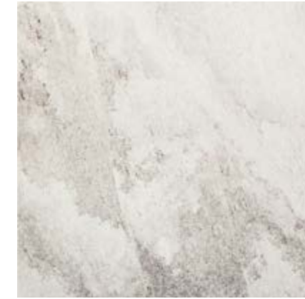
冰川灰 • Ghiaccio