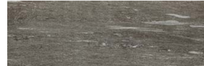
MHD9 炭灰色 • Pietra di Vals20 Antracite 40x120