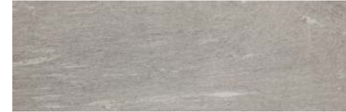
MHDC 淡灰色 • Pietra di Vals20 Greige 40x120