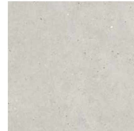
白色 • White