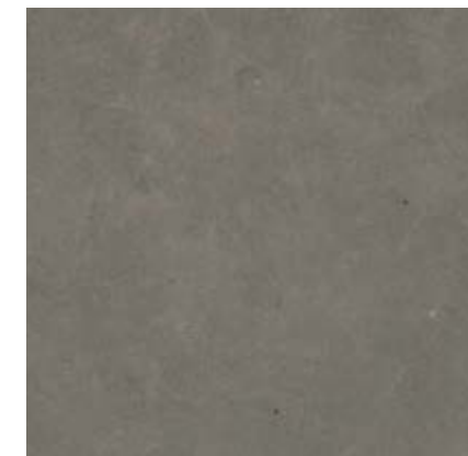
炭灰色 • Anthracite

规格 • Sizes • Formati • Formats • Formate • Formatos