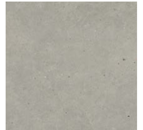
灰色 • Grey