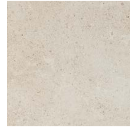
米白色 • Bianco