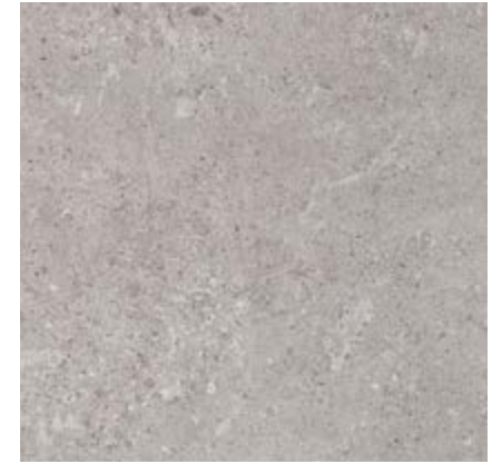
浅灰色 • Grigio

规格 • Sizes • Formati • Formats • Formate • Formatos