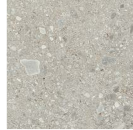
灰色 • Grey

符合 • According to • Conforme • Conforme • Gemäß • Conforme UNI EN 14411 - G Bla