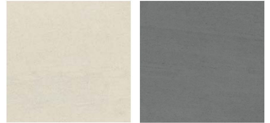
岩灰色 • Pomice