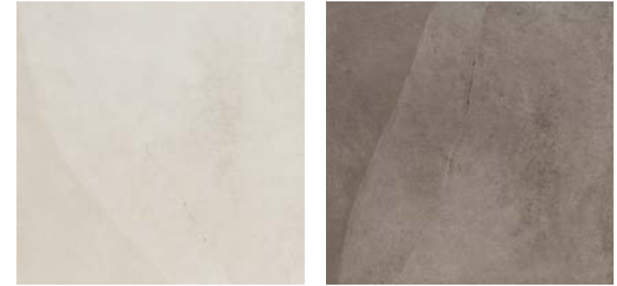
米白色 • Bianco