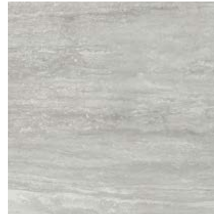
罗马洞石灰 • Travertino Grigio