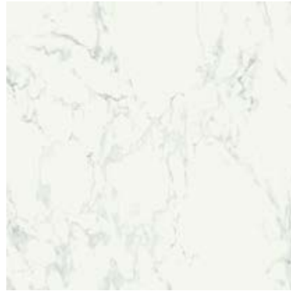
淡雅白 • White

符合 • According to • Conforme • Conforme • Gemäß • Conforme UNI EN 14411 - G Bla