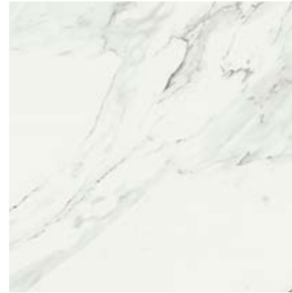
中花白 • Venato