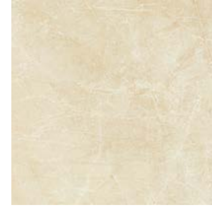
马菲尔黄 • Marfil