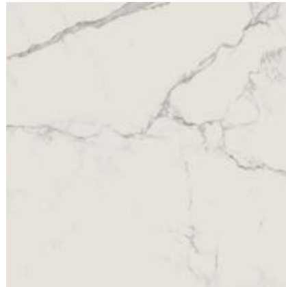
雕刻白 • Statuarietto