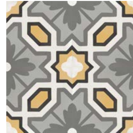
M1L5 花砖 • Tappeto 6 20x20 *

Rif. 白色/魅影灰/橘红色 • Chalk /Midnight / Tangerine