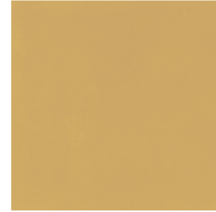
芥黄色 • Mustard

M1KT 芥黄色 • D_Segni Colore Mustard M1KU 橘红色 • D_Segni Colore Tangerine