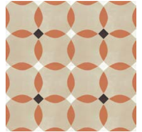
M1L7 花砖 • Tappeto 8 20x20